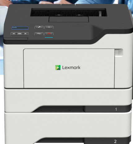
MS421dw s voliteľným zásobníkom

Spôľahlivosť. Zabezpečenie. Produktivita.