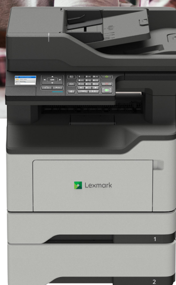
MB2338adw s voliteľným zásobníkom